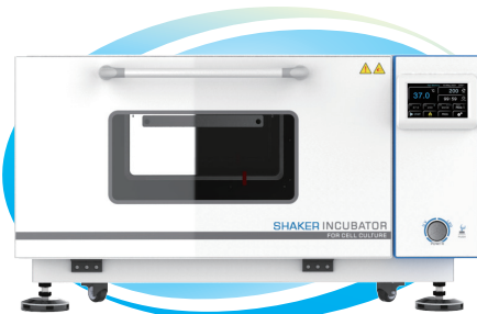
HZQ-101(C) HZQ-111(C) HZQ-121(C)