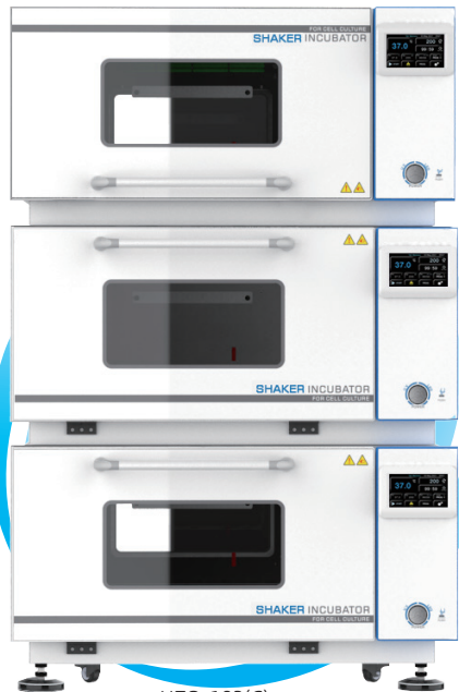
HZQ-103(C) HZQ-113(C) HZQ-123(C)