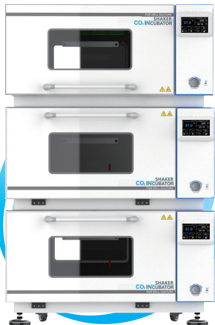
BPNZ-103C BPNZ-113C BPNZ-123C