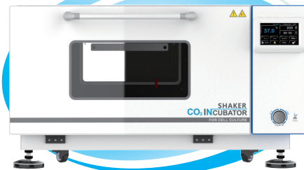
BPNZ-101C BPNZ-111C BPNZ-121C