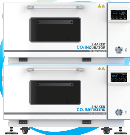
BPNZ-102C BPNZ-112C BPNZ-122C