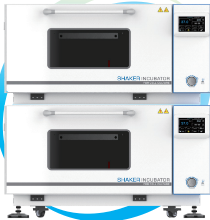
HZQ-102(C) HZQ-112(C) HZQ-122(C)